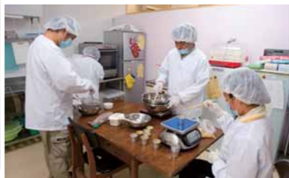
店内から厨房でお菓子作りをしている様子が見え、利用者とお客さんが顔なじみになっています。