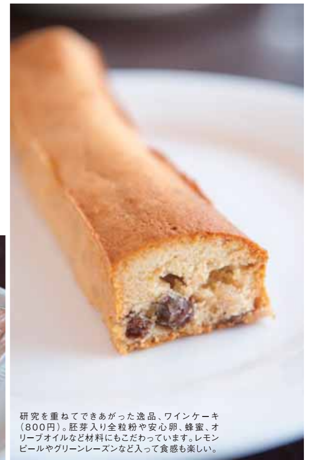
研究を重ねてできあがった逸品、ワインケーキ(800円)。胚芽入り全粒粉や安心卵、蜂蜜、オリーブオイルなど材料にもこだわっています。レモンピールやグリーンレーズンなど入って食感も楽しい。