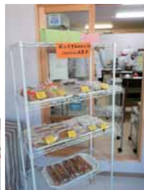
できたてのケーキやクッキーが並んで香ばしい匂いが。お菓子は結婚式の引き出物にとの注文も多いそう。