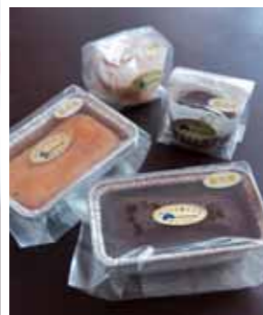
甘さ控えめで栗たっぷりの「ほっこり栗チョコ」(写真右)と、甘酸っぱくて意外なおいしさの「はんなりパインチーズ」(左)。各350円、カップケーキサイズ150円も有。