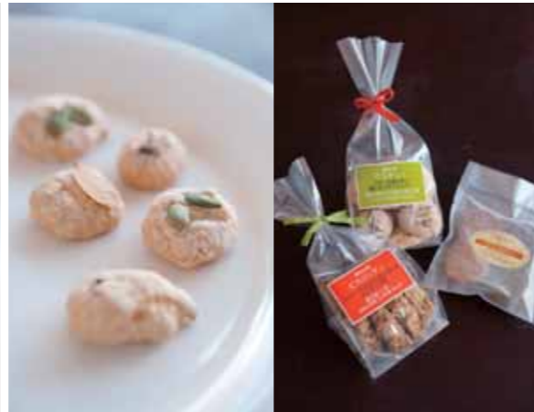
ビスキュイ(写真左)やビスコッティ(中央・各200円)など焼き菓子はどれも国産小麦粉、きび砂糖、安心卵など良質の材料。クッキー(右・150円)はよもぎ、こま、胚芽、ココアアーモンドの4種類のミックス。