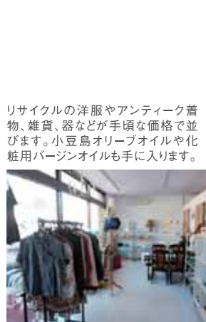
リサイクルの洋服やアンティーク着物、雑貨、器などが手頃な価格で並びます。小豆島オリーブオイルや化粧用バージンオイルも手に入ります。